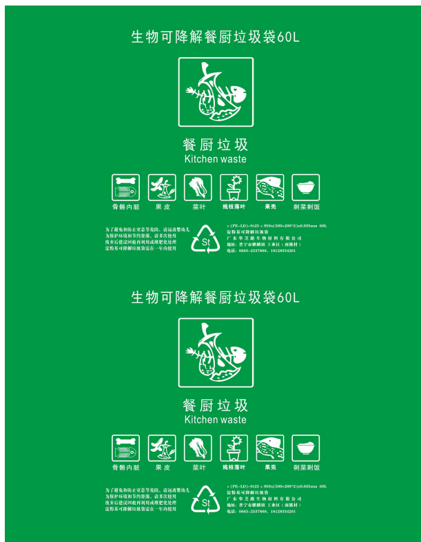
参考图：60 升可降解垃圾分类袋

▲（5）投标人需提交国家有关权威部门出具的对产品同类产品性能测试报告复印件加盖投标人公章(检测报告应出具检测官方查伪电话和网站，如报告书为英文，必须提供由有资质的专业翻译机构翻译的中文译件，中标后需提交报告原件给采购人验证)。